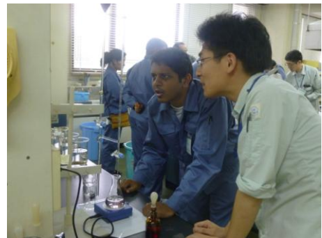
海外技術研修員受入れの様子

諸外国の水道技術向上に貢献するため、独立行政法人国際協力機構（JICA）を通じた海外技術研修員の受け入れを行います。また、平成 27 年 3 月に本市で開催される国連世界防災会議において震災を教訓とした施設強靱化や日本の水道システムの優位性等を国内外に向けて発信します。