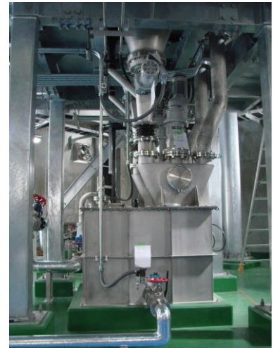
粉末活性炭注入設備