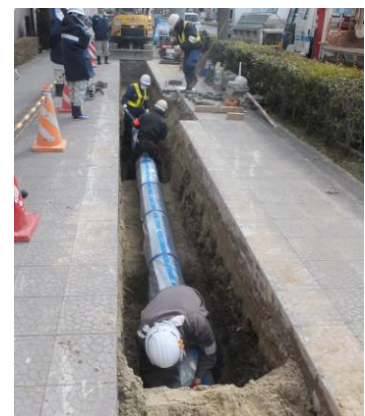
耐震管への更新工事