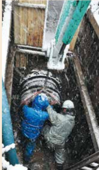
懸命な復旧作業(青葉区旭ヶ丘)