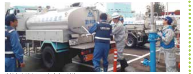
札幌市・新潟市との3都市合同訓練

特に、札幌市・東京都・新潟市の水道局と、定期的な災害対応合同訓練を行い、応援隊の派遣、受け入れ、応急給水活動など、連携の強化を図っています。