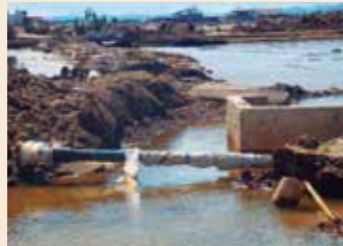
津波で道路が流されても残った耐震管(若林区荒浜)

また、ご家庭での水の備蓄、地域での助け合いによる応急給水体制の構築など、いざというときに「市民力」が最大限に発揮されるしくみづくりを進め、「自助」・「共助」・「公助」による災害対応力の向上を目指しています。