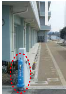
七北田小学校に設置した災害時給水栓