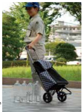
このキャスター付きバッグで8Lの水が運べます

給水所には、ふたの閉まるポリタンクやペットボトルなどの容器をお持ちください。また、水は意外と重いものです。容器を入れるためのリュックやキャスター付きのバッグを用意しておく、と便利です。