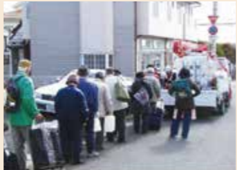
多くの給水所で行われた他都市応援隊による応急給水