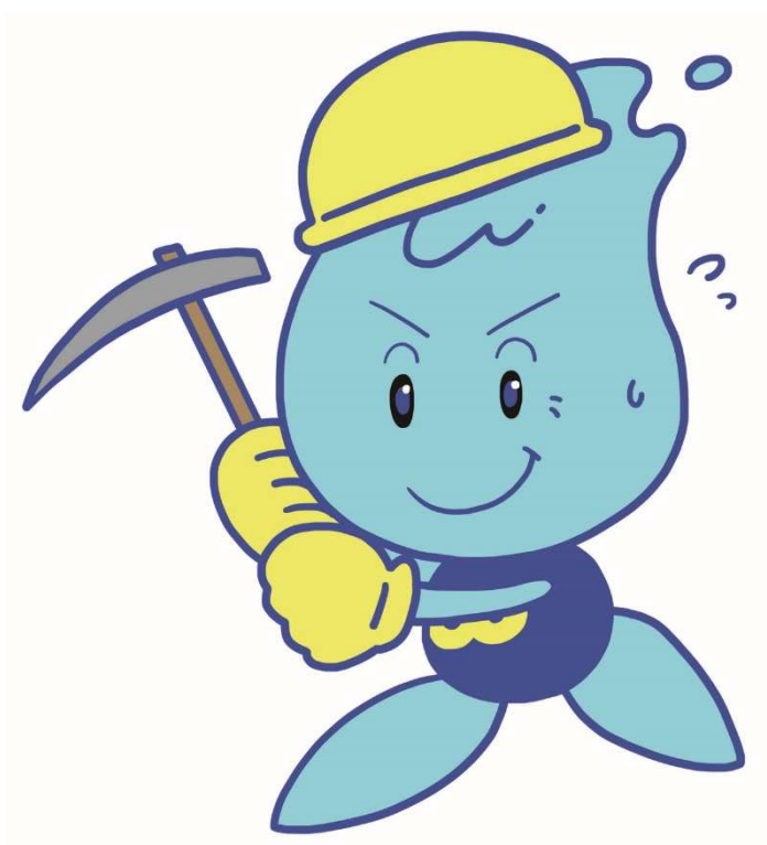
仙台市水道局マスコットキャラクター “ウォーターくん”